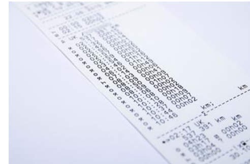
Krav til effektivisering